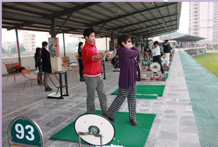
专业高尔夫教练一对一教学

12月25日，中山大学企业家校友联合会在江山帝景高尔夫俱乐部举办了高尔夫“圣诞嘉年华”活动，近30位企业家校友参加了聚会。