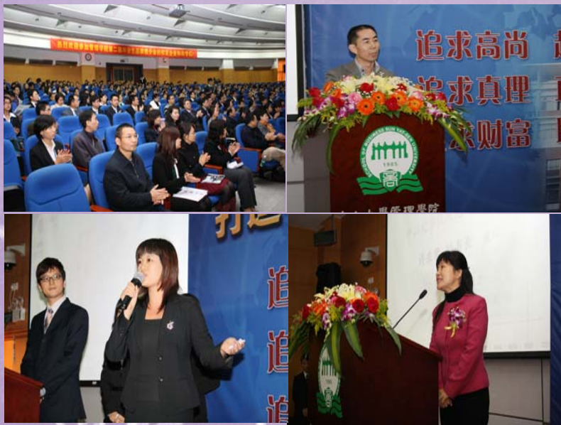
毕业生品牌推介会现场