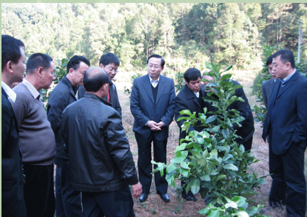
郑书记深入农村果园进行实地考察

12月21日，校党委书记郑德涛率我校专家学者、部分二级党委（党总支）书记、高等继续教育学院负责人及该院博学同学会会员等一行人，前往河源市紫金县龙窝镇琴口村考察对口扶贫开发工作。